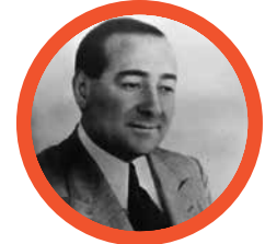
ADNAN MENDERES (1899 - 1961)