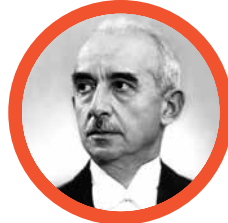
İSMET İNÖNÜ (1884 - 1973)