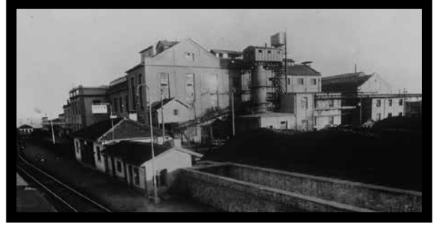
Uşak Şeker Fabrikası