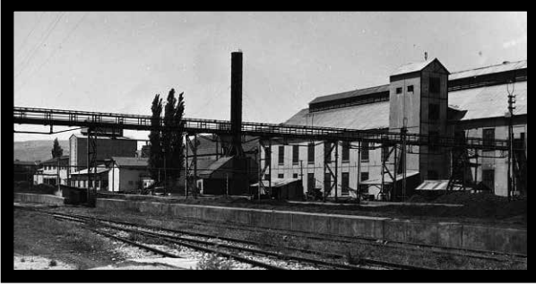
Alpullu Şeker Fabrikası

Türkiye Cumhuriyeti'nin bu döneminde "üç beyaz" (un, şeker ve pamuklu dokuma) olarak adlandırılan temel ihtiyaç maddelerinden şeker üretmek için iki fabrika kuruldu. Kırklareli'nin Alpullu ilçesinde kurulan ve 26 Kasım 1926 tarihinde açılan Alpullu Şeker Fabrikası Türkiye'nin ilk şeker fabrikasıdır. Alpullu şeker fabrikasını 17 Aralık 1926 tarihinde açılan Uşak Şeker Fabrikası izledi.