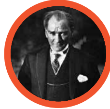
MUSTAFA KEMAL ATATÜRK (1881- 1938)